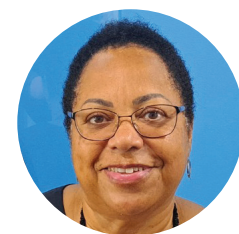
Diretora do Instituto de Letras da UERJ

“ Para mim, o inglês não é apenas a língua inglesa. Ela abre possibilidades de outros estudos, de conhecimento e cultura. Esse é o lado bom de aprender inglês. Eu gostaria que todos tivessem a mesma oportunidade, mas infelizmente isso não é a realidade