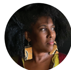
Professora de inglês de escola pública, em Salvador, BA

“O ensino da língua inglesa é muito elitista, muito branco. Então estou ensinando inglês sem priorizar a cultura estadunidense ou a cultura britânica, porque se for assim os alunos não se vêem